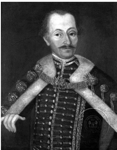
Репрод. 3. Стефан Тенецки: Ранко Текелија, 1740–1750. уље на платну, 67 x 55 cm, ГМС Нови Сад

Сликар Стефан Тенецки је у ликовној теорији перципиран као сликар који је српској култури оставио први натуралистички ауто-портрет. Рафинирано и фактографски тачно је на своја платна преносио тадашње естетске норме у уметности. Тенецки је био познавалац сликарског заната и један је од најзначајнијих српских портретиста XVIII века. Као веома популаран и цењен портретиста Тенецки је био један од најплоднијих банатских сликара друге половине XVIII века.