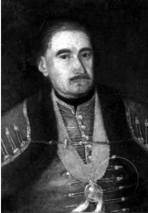
Репрод. 10. Стефан Тенецки: Јован Текелија, око 1770. уље на платну, 66 x 48 cm

траг својим „Мемоарима”. Поред несумњивог доприноса у оквирима националне књижевности Текелијини „Мемоари“ представљају и значајно сведочанство о културолошким приликама његовог доба.