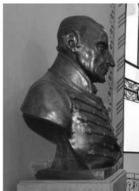
Репрод. 21 и 22. Аутор непознат: Сава Текелија, бронза, Зграда Текелијанума, Арад

На фасади између другог и трећег спрата зграде Текелијанум у Пешти постављена су три рељефа изливена у част Саве Текелије и оснивања Текелијанума. Рељефи су изливени у бронзи у техници ду-