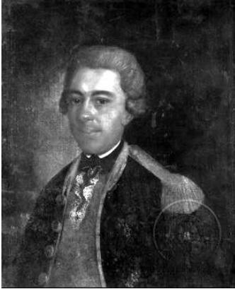
Репрод. 8. Стефан Тенецки: Павле Текелија, око 1749. уље на платну, 64 x 56 cm, ГМС Нови Сад

вене боје. Павле је представљен у маниру тадашњег репрезентативног барокно-класицистичког портрета.