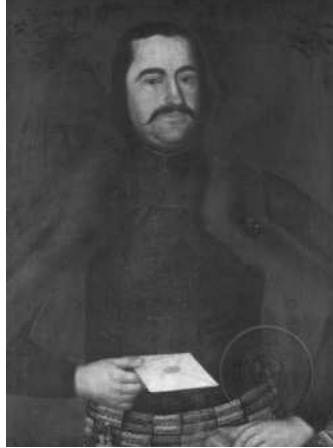
Репрод. 9. Стефан Тенецки: Лазар Текелија, око 1773. уље на платну, 79,5 x 61 cm, ГМС Нови Сад

пуности приближило принципима неокласицизма и рокајне уметности. Такав став потврђује и портрет Марте Текелије.