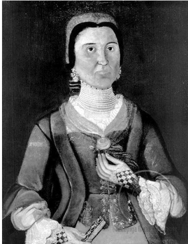
Репрод. 2. Непознати аутор: Еуфросина (Роксанда) Текелија, око 1730. уље на платну, 75 x 60 cm, ГМС Нови Сад

У случају трагања за хронолошким паралелама са кретањима у европском сликарству Еуфросинин портрет је време рококоа. Међутим, суштински најреалиније је сагледати портрет Роксанде Поповић у контексту аутономне морфогенезе српске уметности. Трагање за стилским или хронолошким аналогијама са европским сликарством је готово илузорно. Портрету Еуфросине Роксанде Текелије припада запажно место у морфогенеолошким дешавањима српског сликарства и као такав завређује потребу за стилском валоризацијом у оквирима националне историје уметности.