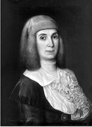
Репрод. 12. Теодор Илић Чешљар: Алоџија (Алка) Путник, 1783–1790. уље на платну, 62 x 46 cm, ГМС Нови Сад

чиме завређује да се његова улога ревалоризује и у историјату српске педагогије.