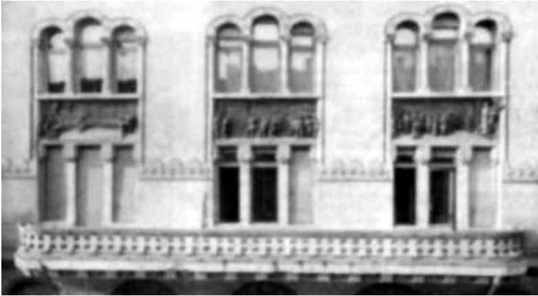
Репрод. 23. Улична фасада зграде Текелијанума са бронзаним рељефима

боког рељефа. Фигуре које представљају Саву Текелију условно је могуће ставити у категорију портретске уметности. Портрети Текелије су идеализовани и поред чињенице да је постојала тежња да се досегне одређена индивидуална карактерологија физиономије лица.