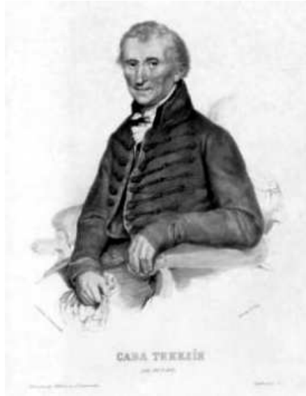
Репрод. 18. Анастас Јовановић: Сава Текелија, литографија, 1850.

Скулпторални портрет у српској култури јавља се веома касно у задњим деценијама XIX века. Те је један од разлога да данас постоји само неколико скулпторалних портрета Саве Текелије. Сви ти портрети су настали након његове смрти. Испред зграде Матице српске налази се портретска биста Саве Текелије рад академског скулптора Јована Солдатовића из 1976. Солдатовић је дипломирао на Академији ликовних уметности у Београду и неко време био сарадник Томе Росандића. Припада категорији најцењенијих српских вајара. Портрет Саве Текелије припада традицији реализма, међутим Солдатовић у скулпторални портрет Саве Текелије уноси и модерничке тенденције карактеристичне за естетику његовог стваралачког опуса. Познате су две варијанте Солдатовићеве бисте Јована Текелије (Репродукције 19 и 29).