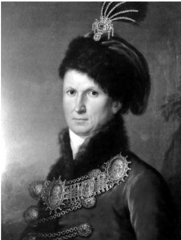
Репрод. 14. Јанош Донат Даниел: Сава Теклија, 1808, уље на платну, Музеј српске православне епархије Будимске, Сентандреја

Млади Сава Текелија је дат у овалном формату. Одевен је у тадашњи грађански костим више средње класе. Лице је емотивно оживљено једним благим осмехом који је израз тадашњег просветитељског сентиментализма. На портрету Младог Саве Текелије, а касније и на одређеним другим портретима присутна је тежња да се портретисани представи као просветитељ. На портрету се исчитавају одређени идејно-филозофски ставови, портретисани свом народу исказује одређене моралне принципе. Портрет младог Саве Текелије настаје у време Француске буржоаске револуције у коме француско и европско друштво осцилују између републике и монархије. На Савином портрету је присутна и идеја предромантичарске интелектуалне револуције.