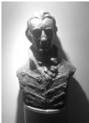
Репрод. 19 и 20. Јован Солдатовић: Сава Текелија, два одливка у бронзи, 1976.

У главном холу зграде Текелијанума налази се и још једна биста Саве Текелије.