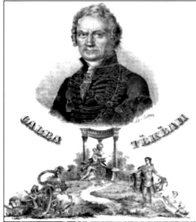
Репрод. 15. Насловна страна Српског народног листа бр. 25, 1835

у парадној одећи са богатом лентом на којој су два ордена. Фигура је дата у амбијенту пасторалног пејзажа. На тој слици Јанош Донат потврђује своје познавање европског сликарства. Портрет Текелије је натуралистички тачан, пикторалност слике је узведена на високом нивоу, достижући вредности тадашњих најзначајнијих европских портретиста. Однос светлости и валерског нијансирања на слици припада традицији средњеевропске барокне и неокласичне представе портрета.